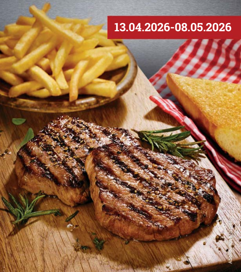
Abbildung entspricht nicht