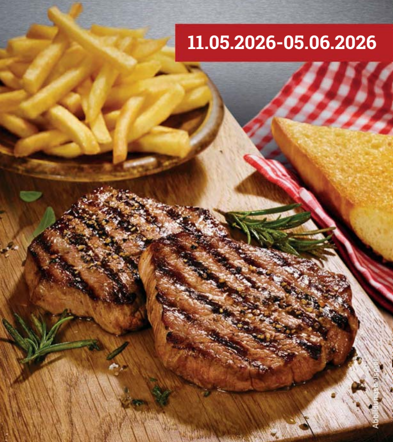
Abbildung entspricht nicht